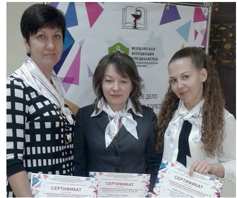
Медицинские сестры на конференции кардиологов и терапевтов в г.Саранске

Постоянная практика и совершенствование знаний и умений медицинского персонала в рамках обучающих программ являются основой профилактики любых осложнений. Предотвращение таких осложнений приводит не только к улучшению исходов заболеваний, но и к снижению сроков пребывания пациентов в ЛПО. Поэтому ассоциация уделяет пристальное внимание непрерывному обучению специалистов сестринского дела, в том числе с использованием симуляционных технологий, организует и проводит мастер-классы для молодых специалистов Центра — студентов или недавних выпускников медицинских училищ и колледжей. В ФЦССХ создана учебная комната, оборудованная всеми необходимыми симуляторами.