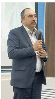
Выступает советник Министра здравоохранения РФ В.Н. Бузин