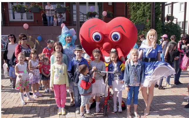
Празднование Международного дня защиты детей в ФЦССХ

рой учащиеся посетили отделение лучевой диагностики, где узнали принцип работы компьютерного и магнитно-резонансного томографов и даже провели исследование. В клиничко-диагностической лаборатории ребята увидели дорогостоящее современное оборудование, рассмотрели в электронный микроскоп клетки крови человека.