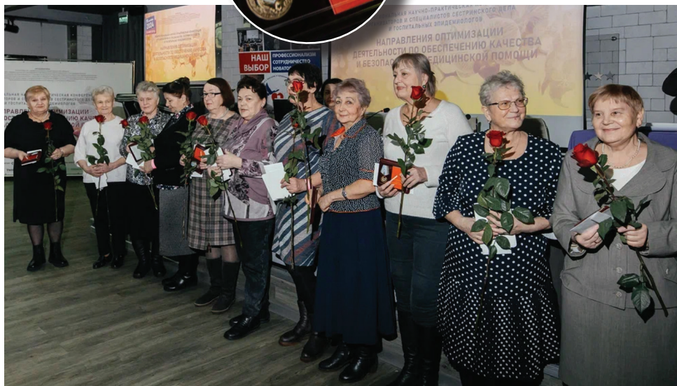
Ветераны службы, награжденные медалью «За милосердие и помощь»

присутствующих были награждены этим нагрудным знаком и поощрены денежной премией ассоциации. За последние 2 года эта уже третья торжественная церемония награждения данной медалью. Всего 42 члена ПАС ВСМФО удостоены такой награды.