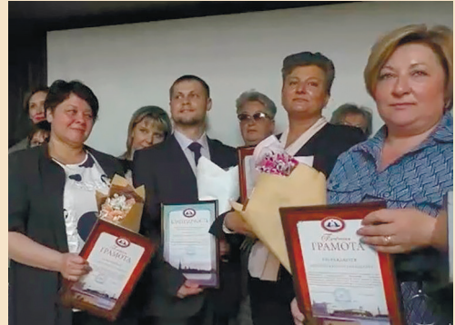
Медицинские сестры – активные члены ПРОО медицинских работников Санкт-Петербурга были награждены медалью «Золотой фонда здравоохранения»

Организатором форума выступили Профессиональная региональная общественная организация медицинских работников Санкт-Петербурга и кафедра гериатрии, пропедевтики и управления в сестринской деятельности федерального государственного бюджетного образовательного учреждения высшего образования «Северо-Западный государственный медицинский университет им. И.И. Мечникова».