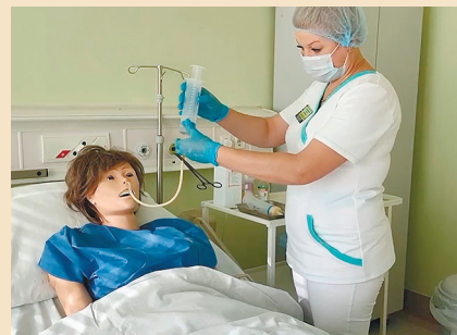
Во второй день работы Всероссийской школы были организованы мастер-классы, посвященные наиболее важным и значимым сестринским технологиям