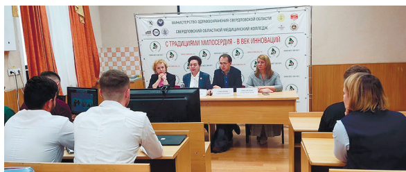
Идет работа симпозиума